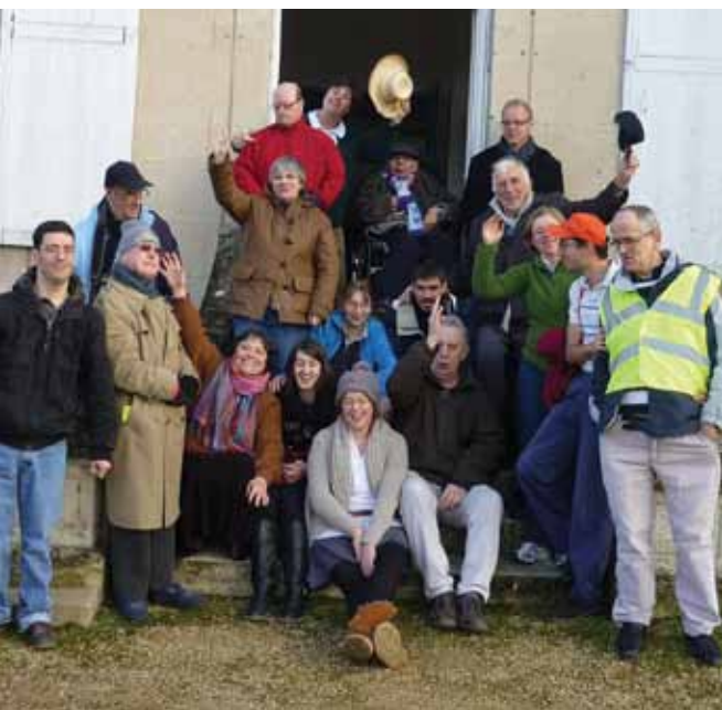
Le foyer du Val Fleuri à L'Arche à Trosly.