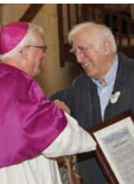
À gauche : Jean Vanier reçoit le prix Pacem in Terris (juillet 2013).