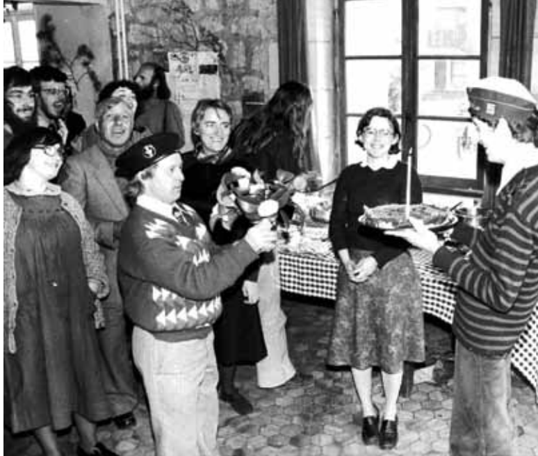
Le premier foyer de L'Arche voit le jour à Trosly-Breuil dans l'Oise.

En 1964, Jean Vanier, touché par la détresse des personnes handicapées placées en asile psychiatrique, décide de vivre avec deux personnes ayant un handicap mental. Ils s'installent dans une petite maison à Trosly-Breuil, premier foyer de L'Arche... On compte aujourd'hui 140 communautés dans le monde, dont 31 en France.