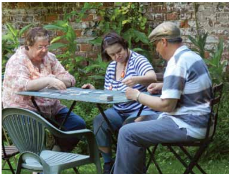
Ci-dessus : partie de cartes dans un foyer. Ci-contre : activité d'équithérapie au SAJ de L'Arche à Beauvais.

Beaucoup de visiteurs viennent à Trosly-Breuil, où L'Arche a commencé. Sur place la communauté a besoin d'aménager et mettre aux normes des lieux d'accueil pour recevoir les visiteurs venus du monde entier.