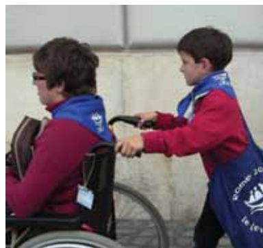
À droite : pèlerinage de L'Arche Le Levain à Rome pour les 30 ans de la communauté.